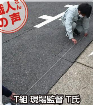
T組 現場監督 T氏