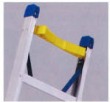
取付用穴付き 定価: 17,000円 ※安全ベルトはお客様での取付になります。