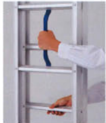
伸縮操作は取っ手と踏ざんを持って行っただけの簡単操作!