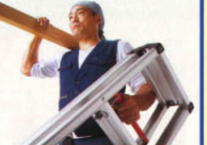
開くと同時に開き止めセット。バーを上げるだけで収納可能。最大30%*の軽量化。*当社比